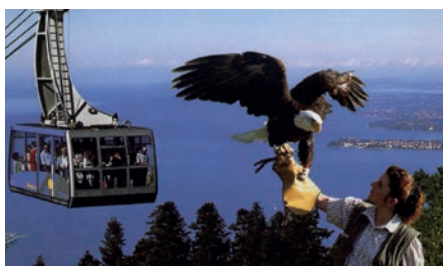
Bregenz Pfänder mit Alpinwildpart