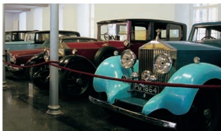
Dornbirn Rolly Royce Museum